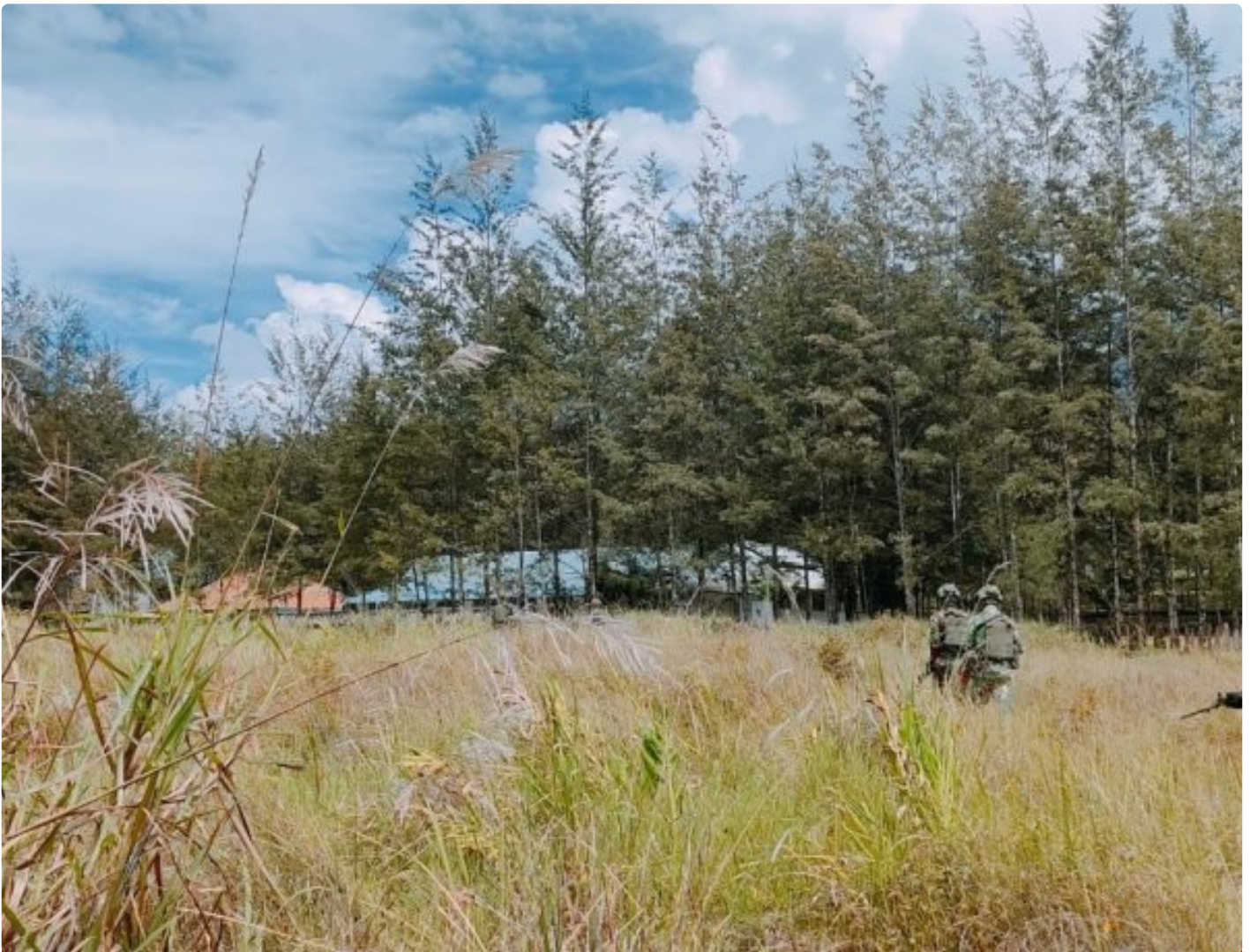
Satgas Yonif 323 Amankan Anggota OPM terduga pelaku tindak Kriminal

Satgas Mobile Yonif 323/Buaya Putih Kostrad berhasil menangkap salah satu anggota Organisasi Papua Merdeka (OPM) yang diduga terlibat dalam sejumlah tindak kriminal di wilayah Papua, Kabupaten Puncak, Penangkapan ini dilakukan